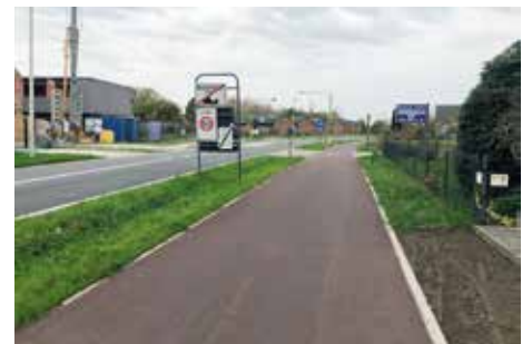
▲ Het fietspad van de Van den Nestlaan werd vernieuwd.