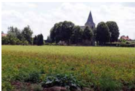
▲ Het gebied aan Millegem-kerk blijft open ruimte.